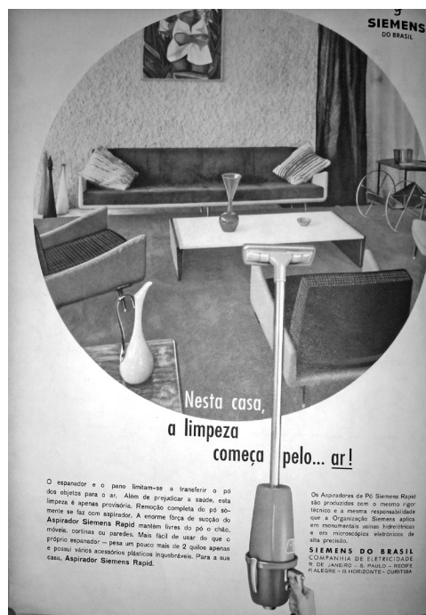
Figura 2. Anúncio Aspirador de Pó Siemens.

(6) Anúncio Exaustor para vitraux Contact. Manchete, 05/05/1956 (n. 211, p. 62). Biblioteca Nacional.