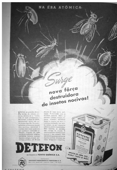
Figura 3. Anúncio inseticida Deteфон.