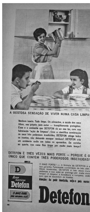
Figura 1. Anúncio inseticida Detefon.

Nenhum inseto, nenhum germe. A casa higiênica deveria apresentar-se livre de qualquer tipo de ameaça. No anúncio do Detefon (Figura 1) a relação entre extermínio dos insetos, higiene e saúde é direta. Além de destruí-los, o inseticida prometia uma “fulminante ‘ação de limpeza’”. As casas podiam contar com um leque de diferentes produtos industrializados que prometiam eliminar as pragas domésticas. Os anunciantes ofereciam um modelo pretendido e idealizado. O espaço doméstico ocuparia o centro das discussões e das preocupações em relação às doenças e à sujeira.